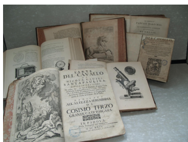
Edizioni antiche e di pregio appartenenti al Fondo Bonadonna